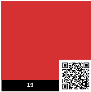
Vermelho / Red / Rouge / Rojo Ral 3020